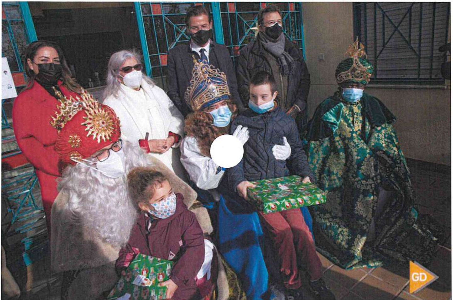
Los Reyes Magos en su visita a la sede de GranaDown

Sus Majestades comenzarán a las 17:00 horas su recorrido en autobús descapotable por las calles de los ocho distritos de la capital